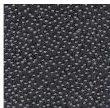
Cat. C Inverno (6525 GRAFITE)

素材：コットン 88%/ ポリエステル 12% 生地幅：140cm メーター単価：¥14,000