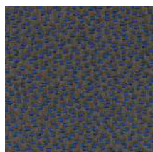
Cat. C Primavera (6300 TABACCO)