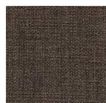
Cat. C Cannella (6300 TABACCO)