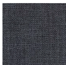
Cat. C Aneto (6475 ANTRACITE)