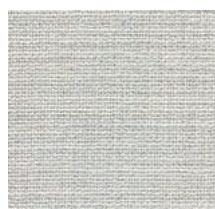
Cat. C Vaniglia (1050 PANNA)