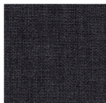
Cat. C Ginepro (6525 GRAFITE)

素材：ビスコース 42%/ コットン 38%/ アクリル 14%/ ポリエステル 6% 生地幅：140cm メーター単価：¥14,000(税抜)