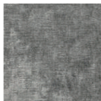
Cat. C Atena (6450 ARDESIA)

素材：ビスコース54% コットン34% ポリエステル12% 生地幅：140cm メーター単価：¥14,000(税抜)