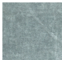
Cat. C Ermes (4325 HARLEY)