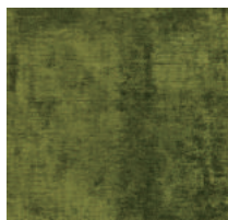
Cat. C Demetra (3225 VERDE)