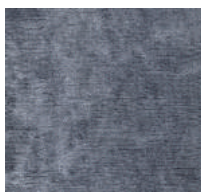
Cat. C Tritone (5350 MARE)