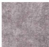
Cat. C Bacco (8450 ROSA)