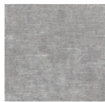
Cat. C Pegaso (6375 PERLA)