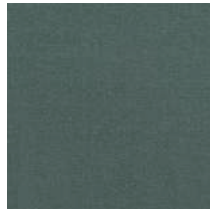
Cat. C Topazio (5350 MARE)