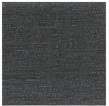
Cat. B Inchiostro (6525 GRAFITE)