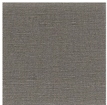
Cat. B Cenere (6300 TABACCO)