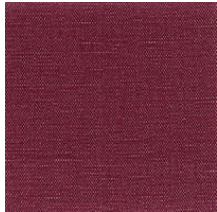
Cat. B Ciliegia (8000 SCOZIA)

素材：コットン 60%/ リネン 40% 生地幅：140cm メーカー単価：¥8,000(税抜)