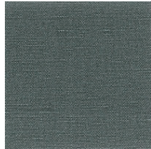
Cat. B Smeraldo (4325 HARLEY)