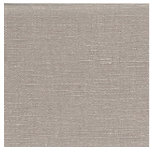
Cat. B Gesso (1225 CORDA)