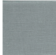
Cat. B Acqua (4325 HARLEY)