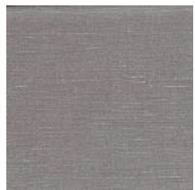
Cat. B Ardesia (3475 SALVIA)