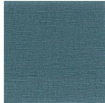
Cat. B Pavone (4525 SPRITZ)