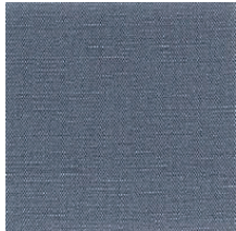
Cat. B Turchese (5225 CIELO)