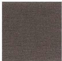
Cat. B Corteccia (1450 NOCCIOLA)