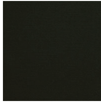
Cat. C Carbone (6550 NERO)