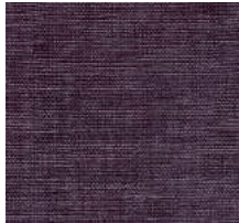
Cat. C Basquiat (8125 BORDEAUX)

素材：リネン 39%/ ジュート 27%/ ビスコース 24%/ コットン 10% 生地幅：140cm メーター単価：¥14,000(税抜)