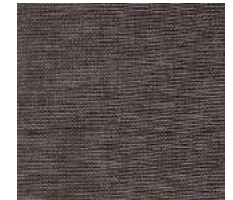
Cat. C Picasso (1450 NOCCIOLA)