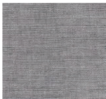
Cat. C Rembrandt (6450 ARDESIA)