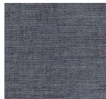
Cat. C Renoir (6475 ANTRACITE)