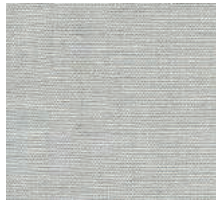
Cat. C Monet (6375 PERLA)