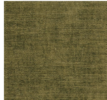
Cat. C Gauguin (3700 SAVANA)