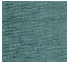
Cat. C Miro (4525 SPRITZ)