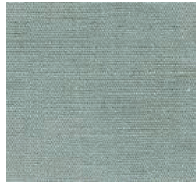
Cat. C Dali (4325 HARLEY)