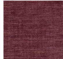
Cat. C Goya (8125 BORDEAUX)