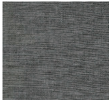
Cat. C Klimt (3475 SALVIA)