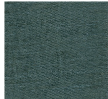
Cat. C Matisse (6525 GRAFITE)