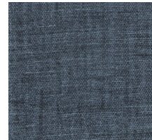
Cat. C Munch (6000 DENIM)