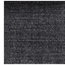
Cat. D Asfalto (6475 ANTRACITE)