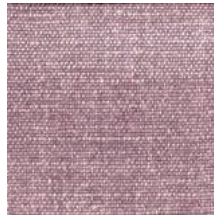
Cat. D Rosa (8450 ROSA)