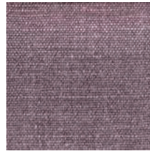
Cat. D Melanzana (8125 BORDEAUX)