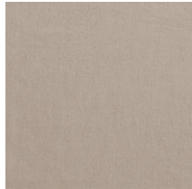
Cat. C Rena 1 (1225 CORDA)

素材：リネン 70%/ コットン 30% 生地幅：280cm メーカー単価：¥28,000(税抜)