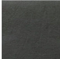
Cat. C Grafite 1 (6450 ARDESIA)