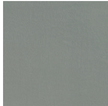
Cat. C Ardesia 1 (6450 ARDESIA)