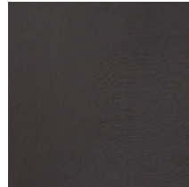
Cat. C Piombo 1 (6300 TABACCO)