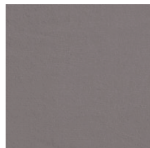
Cat. C Granito 1 (6450 ARDESIA)