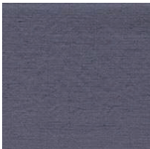
Cat. C Aurora 1 (6125 AVIO)