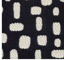
Cat. C Tempesta (6550 NERO)