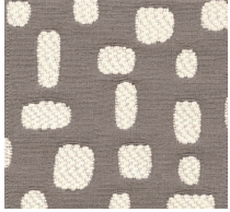
Cat.C Brezza (1450 NOCCIOLA)

素材：アクリル35% コットン32% ポリエステル18% ウール15% 生地幅：140cm