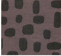
Cat. C Bufera (8450 ROSA)