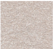
Cat. C Seagull (1050 PANNA)