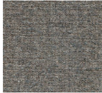
Cat. C Eagle (6525 GRAFITE)