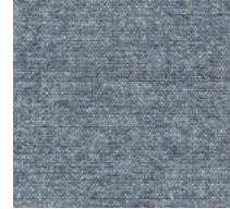
Cat. C Peacock (5350 MARE)