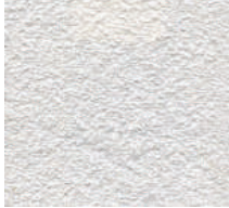
Cat. C Dove (1000 WHITE)