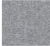
Cat. C Heron (6450 ARDESIA)