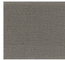
Cat. B Grafite (6450 ARDESIA)