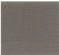
Cat. B Cenere (6300 TABACCO)