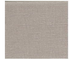
Cat. B Gesso (1225 CORDA)