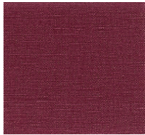
Cat. B Ciliegia (8000 SCOZIA)