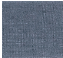
Cat. B Turchese (5225 CIELO)