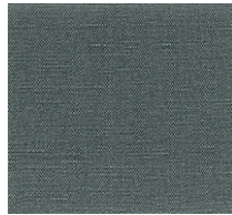
Cat. B Smeraldo (4325 HARLEY)