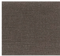
Cat. B Corteccia (1450 NOCCIOLA)