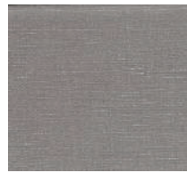
Cat. B Ardesia (3475 SALVIA)