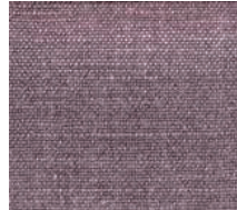
Cat. D Melanzana (8125 BORDEAUX)