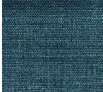
Cat. D Petrolio (4525 SPRITZ)