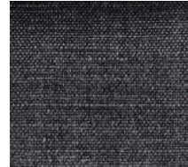
Cat. D Asfalto (6475 ANTRACITE)