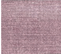
Cat. D Rosa (8450 ROSA)