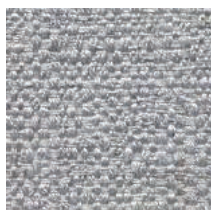
Cat. C Argento (6375 PERLA)

素材：ビスコース 56% / リネン 21% / コットン 14% / アクリル 9% 生地幅：140cm